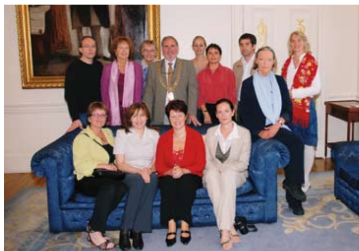
Os membros do Grupo de Trabalho 8 da CCN, num encontro com o Prefeito de Dublin, Irlanda, para debater a Educação para o Desenvolvimento Sustentável.

Os seminários EDS, realizados pelos membros do Grupo de Trabalho 8 centram-se na utilização de metodologias experimentais que incentivem a ‘Educação Para o Desenvolvimento Sustentável’, em vez da ‘Educação Sobre o Desenvolvimento Sustentável’. Por outras palavras, são utilizadas e promovidas abordagens activas de ensino e aprendizagem (metodologias transformadoras), e não as abordagens de ensino/aprendizagem formais ou tradicionais (metodologias transmissoras).