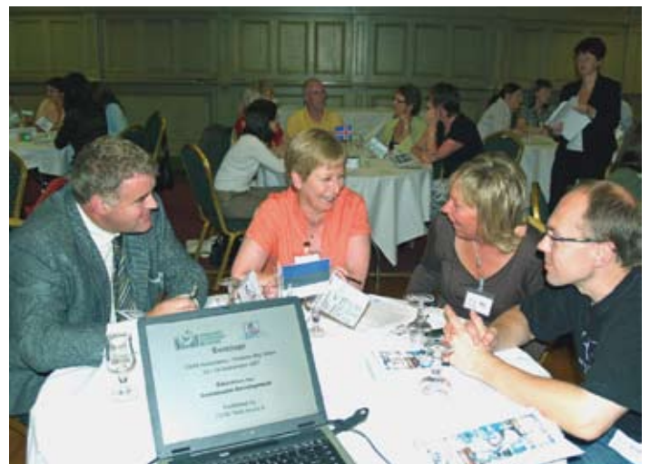
Task Group n°8 do CCN realizando um seminário EDS com formadores de Educação Cívica, Social e Política, em Athlone, Irlanda, 2007.

Na nossa busca de um futuro sustentável, temos de redefinir a nossa posição em relação ao meio ambiente. Não nos podemos dar ao luxo de continuar a reproduzir os nossos erros. Devemos procurar melhores soluções, baseadas em valores de EDS e em abordagens de aprendizagem transformadoras que podem ajudar neste processo.